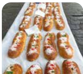
Errosko solidarioaren jaja