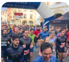
San Antontxuko Herri Krosa